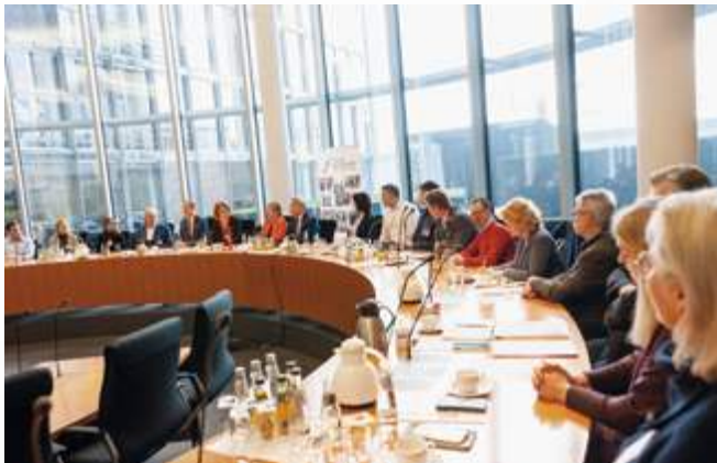
Das Fachgespräch im Paul-Löbe-Haus beinhaltete einen konstruktiven Austausch zwischen Rehabilitand_innen, Reha-Vertreter_innen und Politikern.