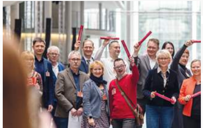
Die Aktion Reha-Zukunftsstaffel brachte die Themen der Rehabilitation in den Bundestag. Gruppenfoto mit den Teilnehmer_innen der Abschlussveranstaltung.

sem Gremium lediglich das Recht zur Stellungnahme, darf keine stimmberechtigten Vertreter in den G-BA entsenden. Dieser Mischstand muss geändert werden.