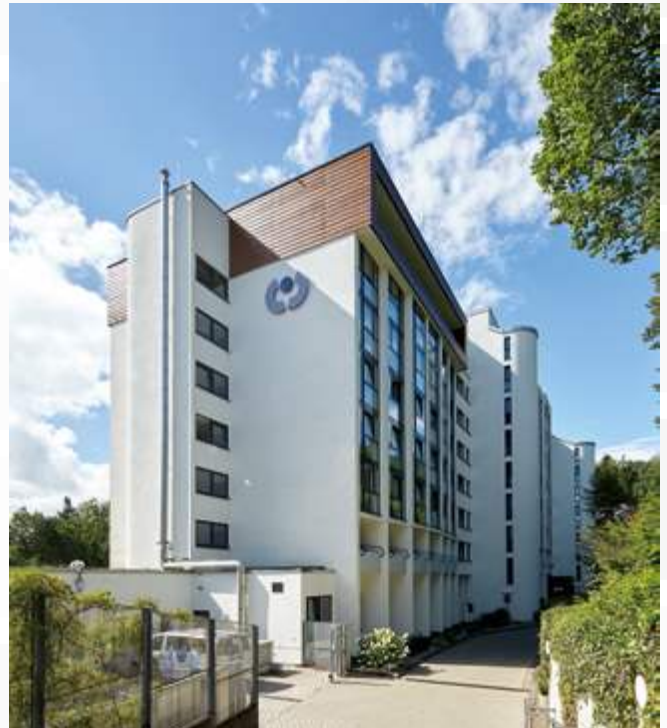
Die Klinik am Hainberg liegt nur wenige Minuten Fußweg vom Zentrum der Stadt Bad Hersfeld und dem malerischen Kurpark entfernt.

Die Klinik verbindet und verknüpft in einem methodenübergreifenden Behandlungskonzept auf der Grundlage eines ganzheitlichen bio-psycho-sozialen Modells verschiedene Elemente aus den gängigen psychotherapeutischen Verfahren, Künstlerischen Therapien, Ergotherapie, Sport-, Physio- und Bewegungstherapie sowie Klinischer Sozialarbeit. Im Mittelpunkt dessen steht der Patient in seiner vollen Individualität: Interdisziplinär arbeiten Ärztliche und Psychologische Therapeuten mit Pflegekräften und weiteren Berufsgruppen Hand in Hand mit dem Ziel, dem Patienten Raum zu geben, um zu sich und seinen