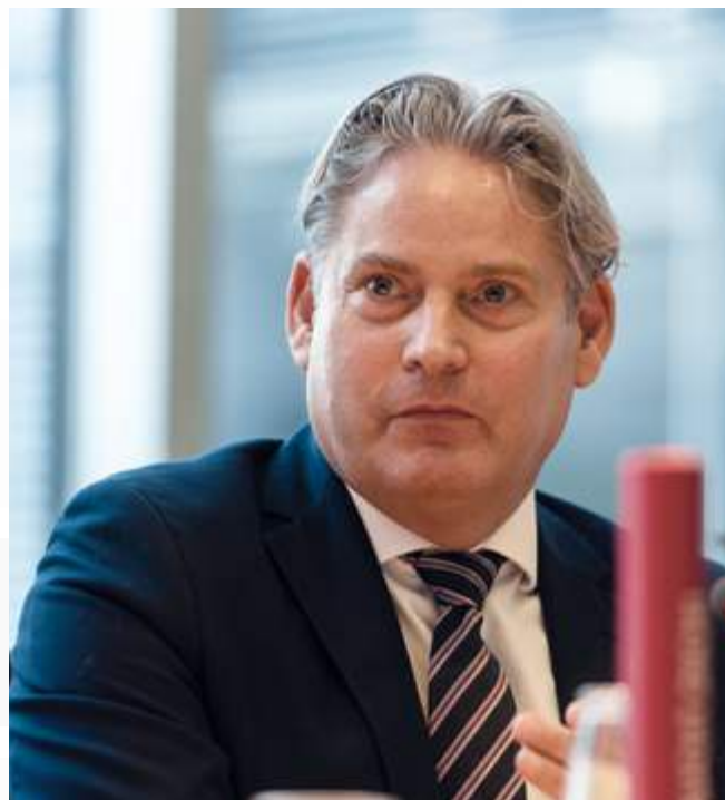
Stefan Zierke ist Wahlkreisabgeordneter der Uckermark und Barnim.

Stefan Zierke ist seit 2013 Mitglied des Bundestages und Sprecher der Landesgruppe Brandenburg in der SPD-Bundestagsfraktion.