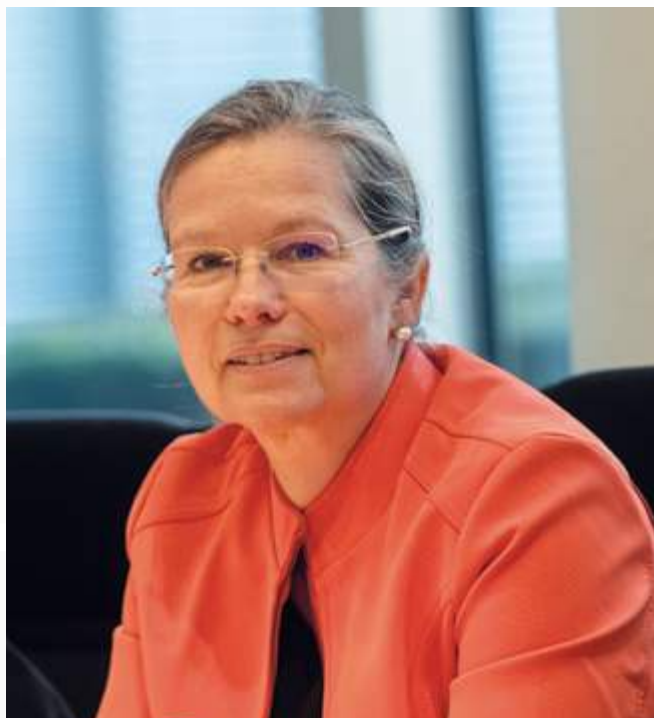
Diana Stöcker ist Bundestagsabgeordnete für den Wahlkreis Lörrach – Müllheim.

Diana Stöcker ist seit 2021 Bundestagsabgeordnete und Mitglied im Ausschuss für Gesundheit des Deutschen Bundestages.