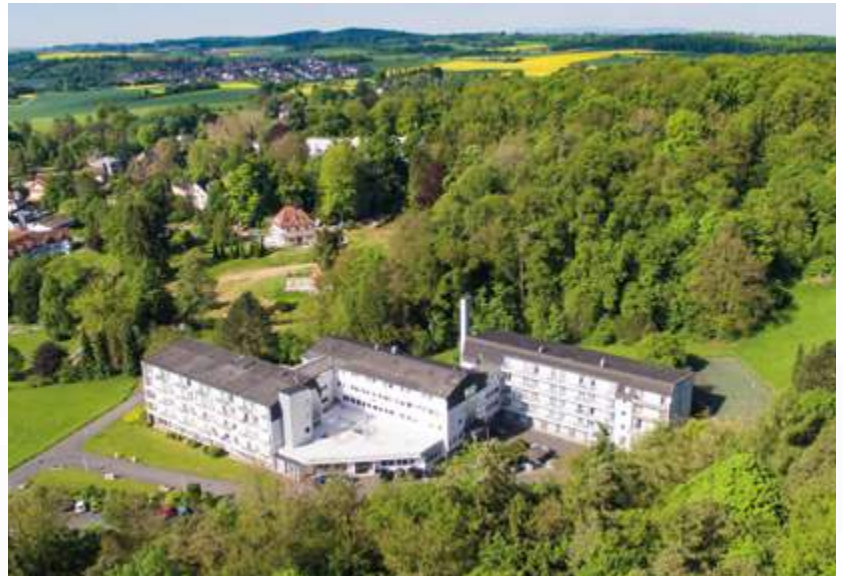
Die Klinik Rabenstein ist als Rehabilitationsklinik auf Erkrankungen in den Bereichen Orthopädie und Innere Medizin spezialisiert.

Unsere Rehabilitationseinrichtung liegt in einem der ältesten Solebäder Deutschlands, dem charmanten Kur- und Heilbad Bad Salzhausen. Idyllisch am Fuße des Vulkan Vogelsberg und in einer fruchtbaren Auenlandschaft gelegen, können unsere Rehabilitanden aufatmen und zur Ruhe kommen.