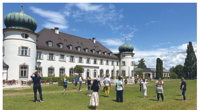
Veranstaltungsort Schloss Höhenried