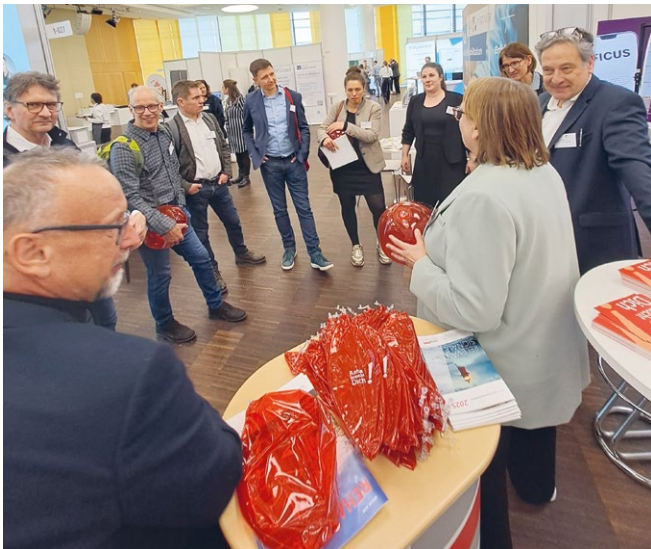
Meet & Greet des AK Prävention am DEGEMED-Stand

Auch das Meet & Greet des Arbeitskreises Prävention erwies sich als wertvolle Plattform für den persönlichen Austausch. DEGEMED-Mitglieder nutzten die Gelegenheit, um aktuelle Entwicklungen und Best Practices zu teilen. (jw)