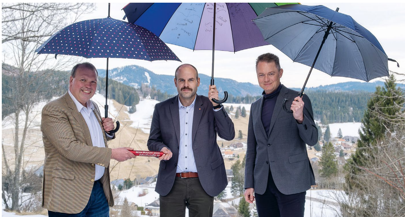
Staffelübergabe an Julian Wiedmann (SPD) in der Eltern-Kind-Fachklinik Tannenhof

Die Kampagne wurde als Reaktion auf die vorgezogene Bundestagswahl nach dem Bruch der Ampelkoalition im November 2024 gestartet. Die symbolische Staffelübergabe soll Politiker_innen vermitteln, was Reha-Einrichtungen brauchen, um für die Zukunft gut aufgestellt zu sein. Das Innovationsforum der DEGEMED entwickelte die Idee für die Aktionen.